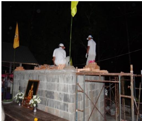
ภาพที่ 1 เริ่มสร้างพระเจ้าทันใจ