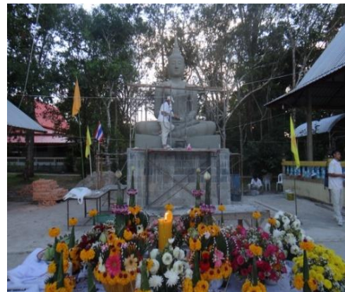
ภาพที่ 3 พระเจ้าทันใจสร้าง 1 วัน