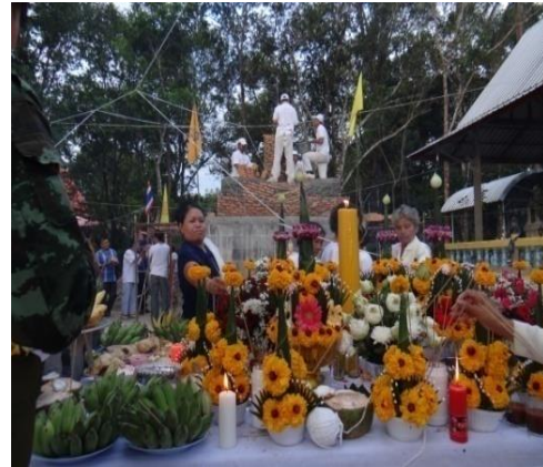
ภาพที่ 2 ผู้ร่วมสร้างพระเจ้าทันใจ

เคยสร้างพระเจ้าทันใจมาแล้ว จึงศรัทธาในปาฏิหาริย์พระเจ้าทันใจ และยินดีร่วมสร้างพระเจ้าทันใจ ทุกโอกาสที่ทำได้ อย่างไรก็ตาม ผู้ดำเนินการจัดสร้างพระเจ้าทันใจ ซึ่งมาจากจังหวัดฉะเชิงเทราและกรุงเทพมหานคร มีเจตนาที่แตกต่าง คือ มุ่งมั่นสร้างพระเจ้าทันใจเพื่อให้เป็นสัญลักษณ์ทางพระพุทธศาสนาและเป็นศูนย์รวมจิตใจของชาวพุทธ